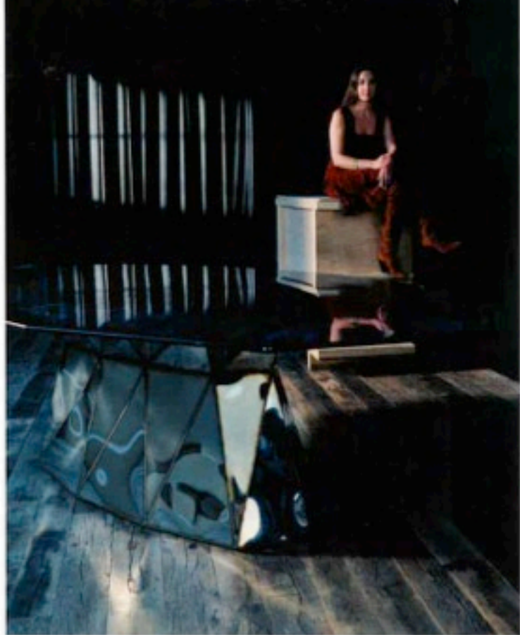
Avant d'être exposée sur Art Paris, la table Parallax de l'artiste anglais Julian Mayor brille de tous ses feux dans le clair-obscur de la galerie d'Armel Soyer, rue Chapon (Paris 10 e ). Le plateau de cette table d'artiste au piètement sculptural est constitué d'un subtil réseau de sangles de carbone pris entre verre et fibre de verre.